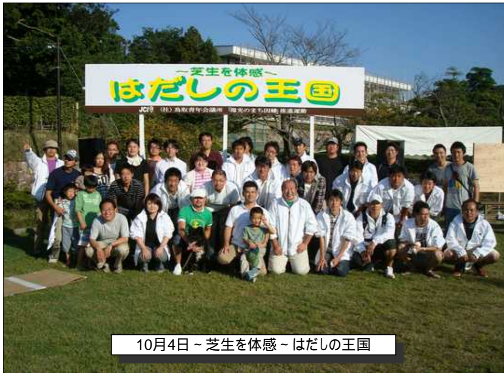
10月4日～芝生を体感～はだしの王国